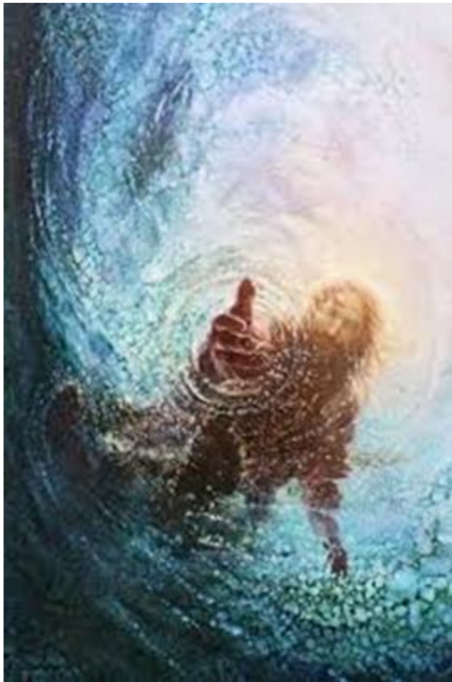
Kuns deur Yongsung Kim