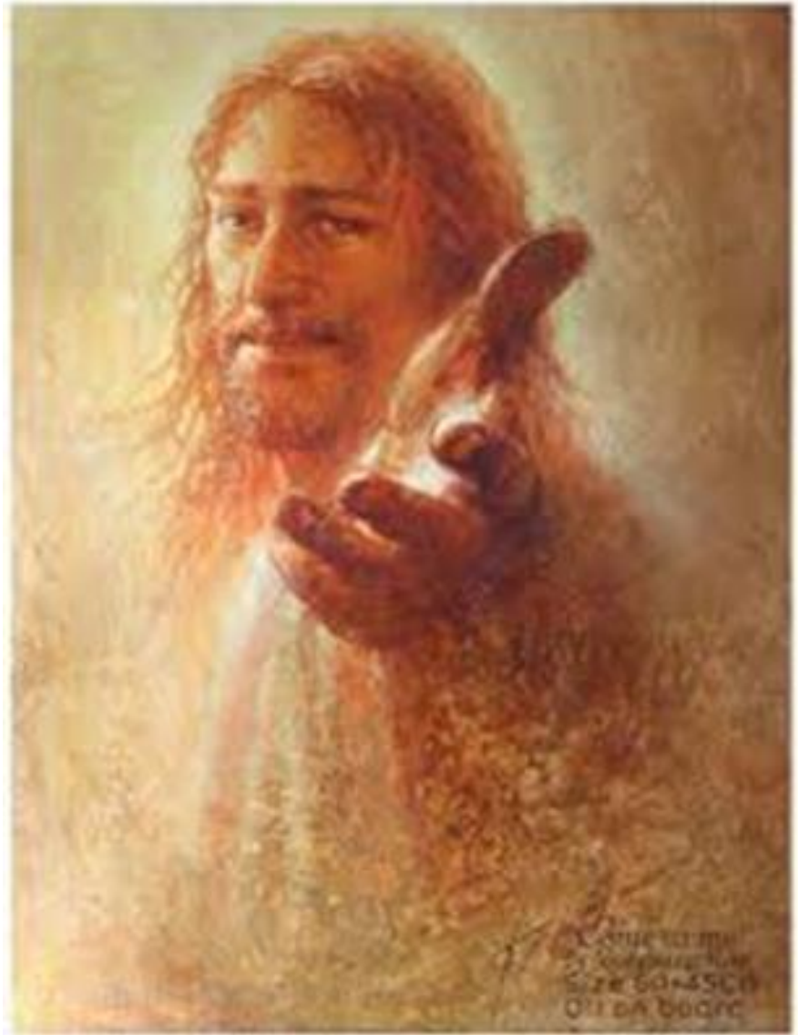
Kuns deur Yongsung Kim