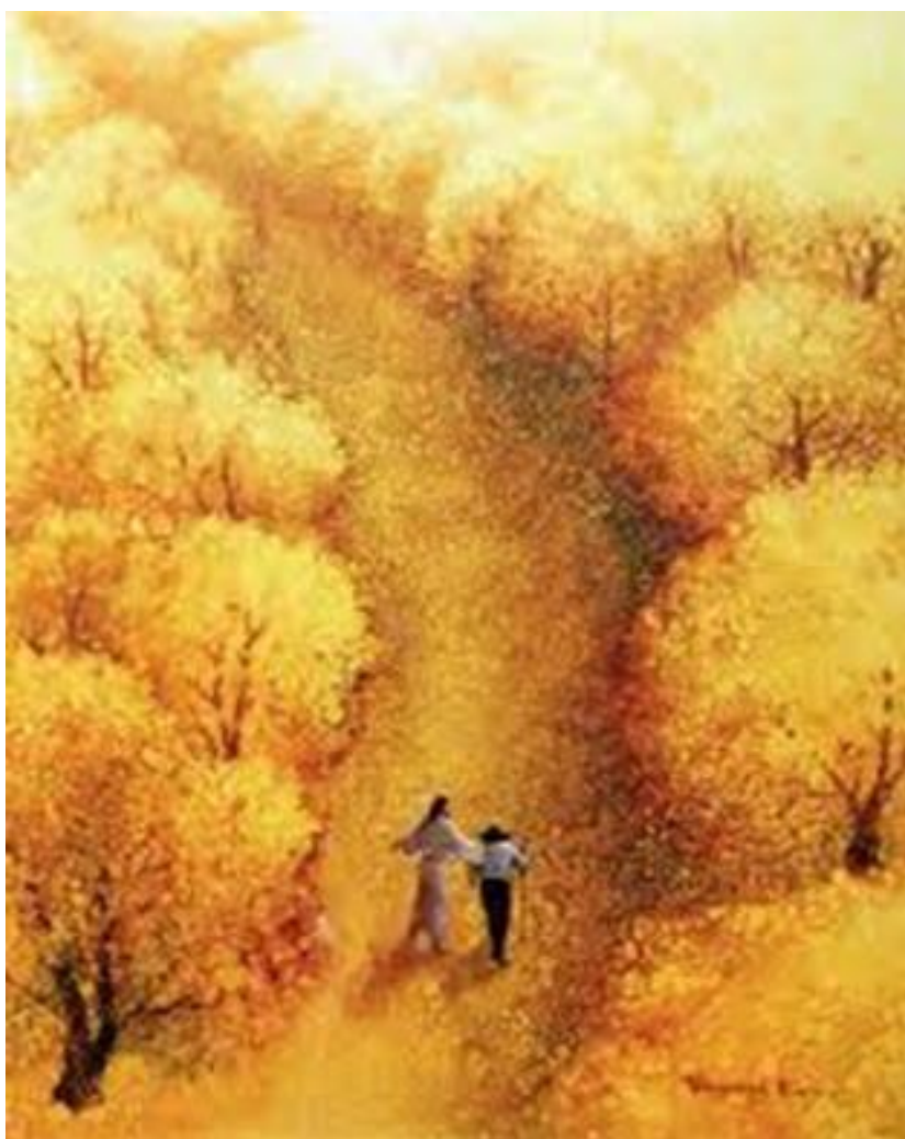
Kuns deur Yongsung Kim